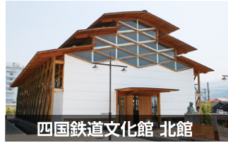
四国鉄道文化館 北館

「鉄道歴史パーク in SAIJO」は、JR伊予西条駅の東隣に位置し、エリア内には、「四国鉄道文化館 北館」「四国鉄道文化館 南館」「十河信二記念館」「観光交流センター」の4施設があります。