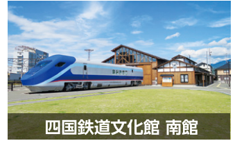
四国鉄道文化館 南館